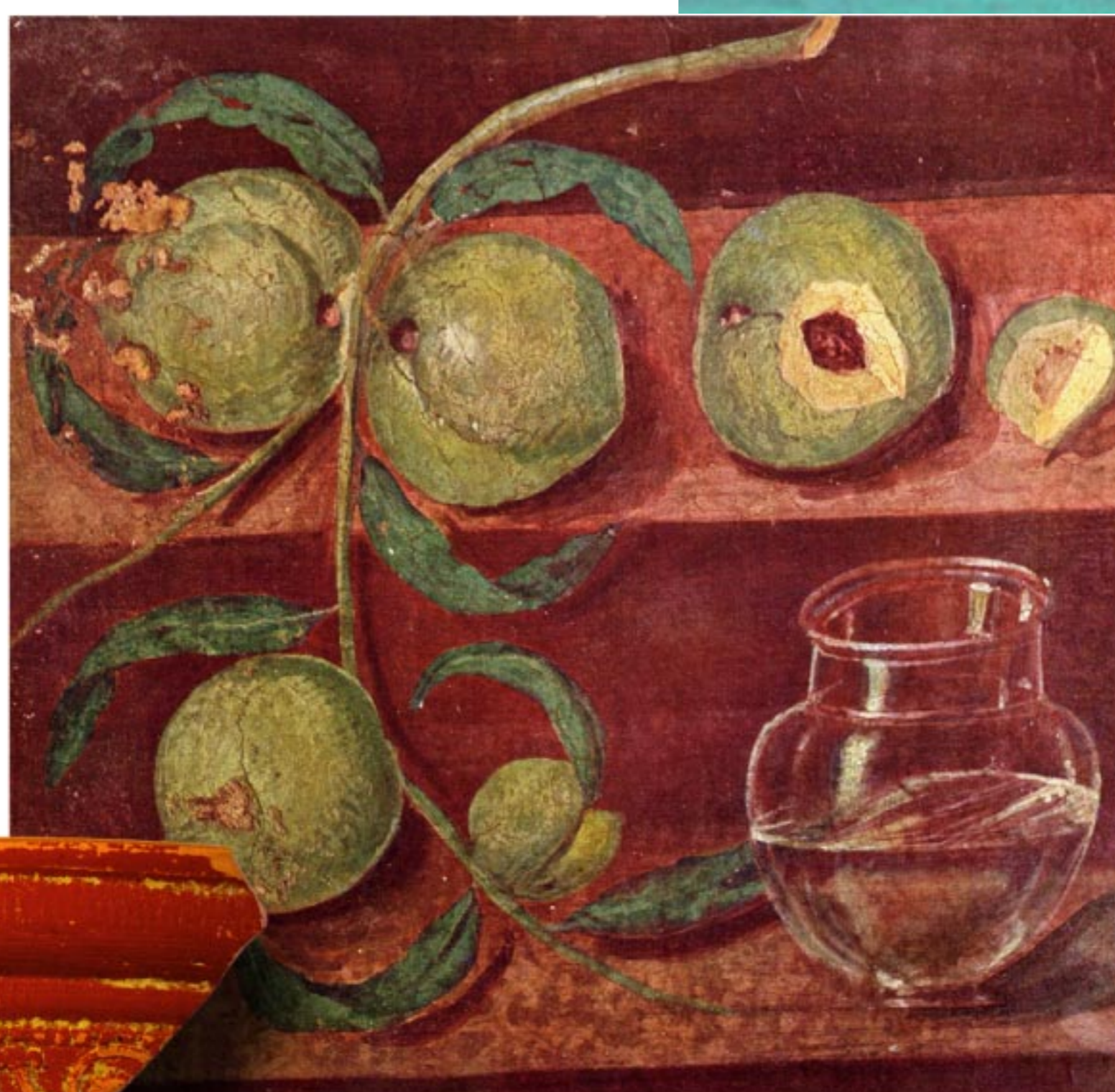
Ar y chwith Darn o grochenwaith Samiaidd, sef llestri bwrdd o ansawdd da wedi'u haddurno, y daethpwyd o hyd iddo yng Nghaersws. Fe wnaed y ddysgl arbennig hon yn yr ardal a elwir bellach yn ne Ffrainc.