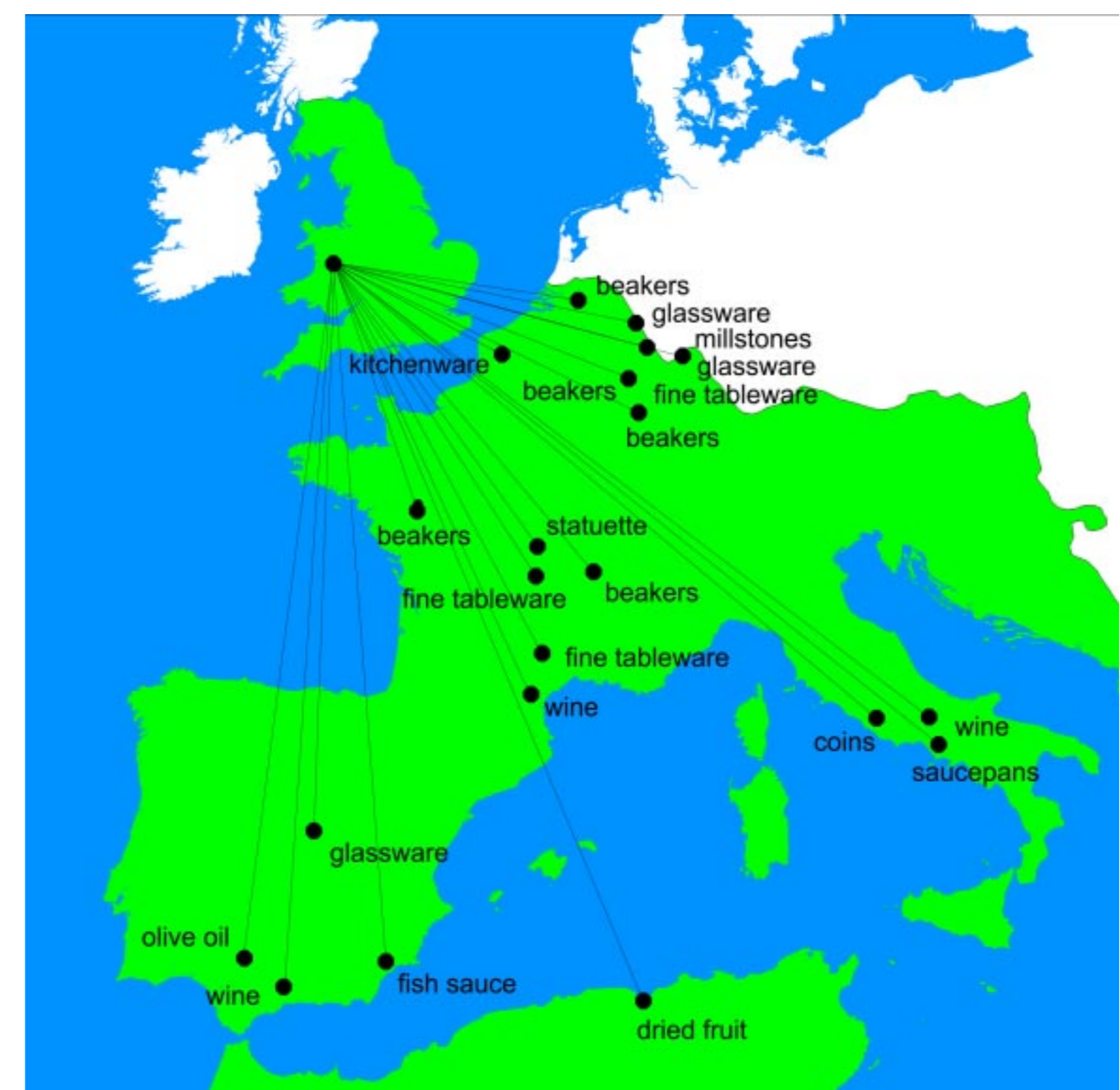
Uchod Darganfyddiadau a gludwyd i Gaersws o fannau eraill yn yr ymerodraeth Rufeinig.