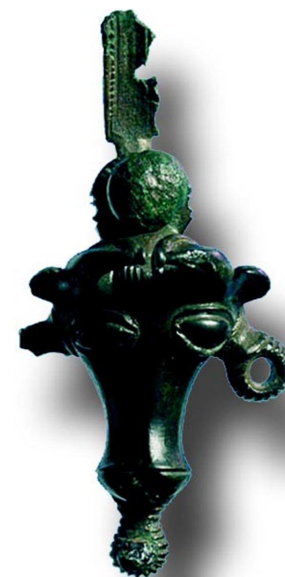
Ar y dde Handlen bwced ar ffurf pen buwch o 'gelc' y Trallwng. Mae arddull Oes yr Haearn sydd i ben y fuwch yn dangos bod crefftwyr lleol wedi dal ati i gynhyrchu nwyddau tan ymhell ar ôl concwest y Rhufeiniaid.